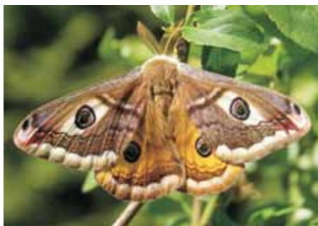
Martináč habrový Saturnia pavonia