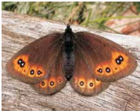
Okáč rosičkový Erebia medusa

Selény byla bohyně a zosobněním měsíce. Na křídlech motýlů se často vyskytují kresby připomínající měsíční srpek a několik druhů motýlů má jméno stejné, mj. perleťovec fialkový, nebo je odvozené ve tvarech selenaria, selenia, nebo selenitica.