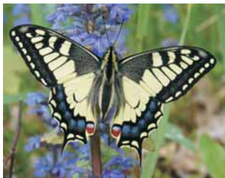
Otakárek fenyklový Papilio machaon

Thersites, Úrania, Zefyros a mnozí další. Na našem a slovenském území se vyskytuje 99 druhů motýlů s takovými jmény.