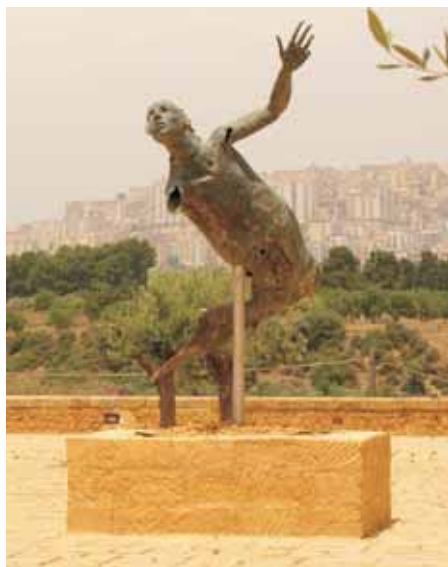
Ikarův pád a nové Agrigento

Působivé zapojení bájných postav do areálu dórských chrámů u sicilského Agrigenta představují současné monumentální sochy Igora Mitoraje.