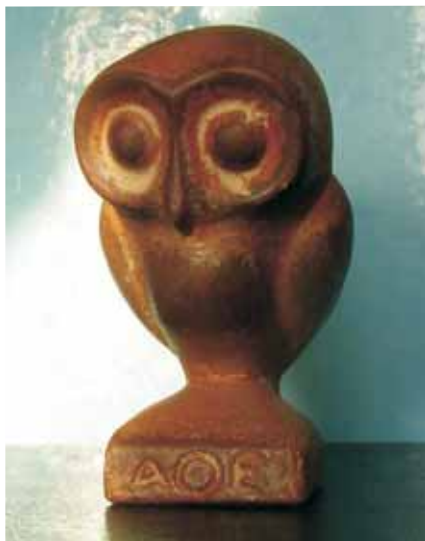
Athénina sova (kopie keramické figurky, Řecko 7. stol. př. n. l.

Druhové jméno běžného okáče bojinkového má původ v mýtu o krásné soše Galathey, do níž se zamiloval její