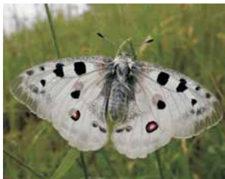
Jasoň červenooký Parnassius apollo

Jméno Parnassius je odvozeno od řeckého vápencového pohoří Parnásu, kde byla proslavená delfská věštkyně, zasvěcená bohu Apollónovi. České rodové jméno jasoň je překladem vlastnosti stálého jasu (řecky Foibós), který Apollón vyzářoval. Jasoň červenooký má vědecké jméno Parnassius apollo a jasoň alpský Parnassius phoebus .