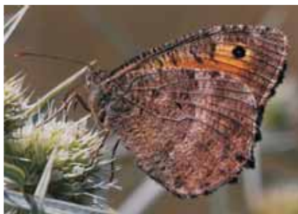
Okáč kostřavový Arethusana arethusa