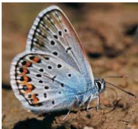
Modrásek černolemý Plebeius argus