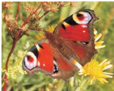
Babočka paví oko Inachis io

Íó byla dcerou říčního boha Inacha a nejvyšší bůh Zeus se do ní zamiloval pro její krásné oči. Krásná oka má na lici svých křídel také babočka paví oko a její vědecké jméno Inachis io obě postavy spojuje.