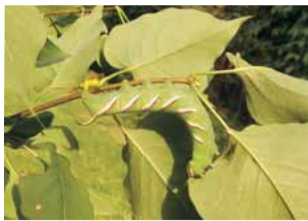
Lišaj šeríkový Sphinx ligustri , housenka

Na hrudi lišaje smrtihlava je kresba, která poněkud připomíná lebku se zkříženými hnáty. Proto býval přilet lišaje v mnoha evropských zemích považován za znamení neštěstí. Z této pověry vychází ponuré rodové jméno Acherontia , které je odvozeno od řeky Acherón v podsvětí, i druhové jméno atropos podle jedné z bohyň osudu, která četla knihu života a určovala hodinu smrti.