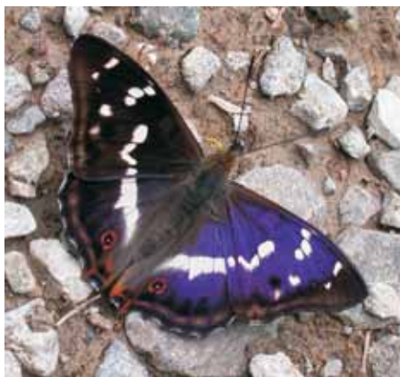
Batolec duhový Apatura iris

Iris byla bohyně duhy a podle ní má druhové jméno denní motýl batolec duhový Apatura iris . Zbarvení křídel se u něj mění podle úhlu dopadu světla (duhuje).