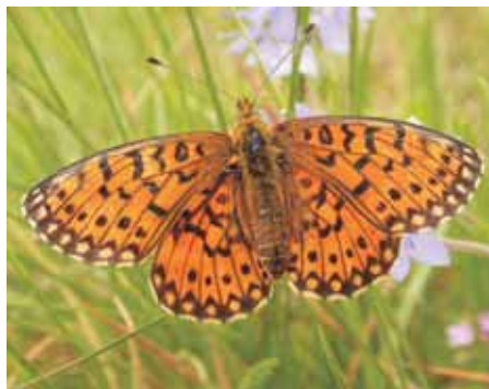
Perleťovec fialkový Boloria selene

Mezi našimi brouky má takové jméno jen výkalník vrubounový Sisyphus schaefferi , který své břemeno nevalí stále na horu jako Sisyfós, první bájný král Korintu, ale svou potravní kuličku z ovčího trusu si zahrabává do země. Atlas, Hercules a Titan jsou mezi jmény velkých exotických brouků, k nimž se dostal i biblický silák Goliáš.