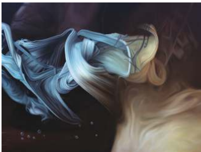
Marek Slavík, Transformation of mind 3 (2017).