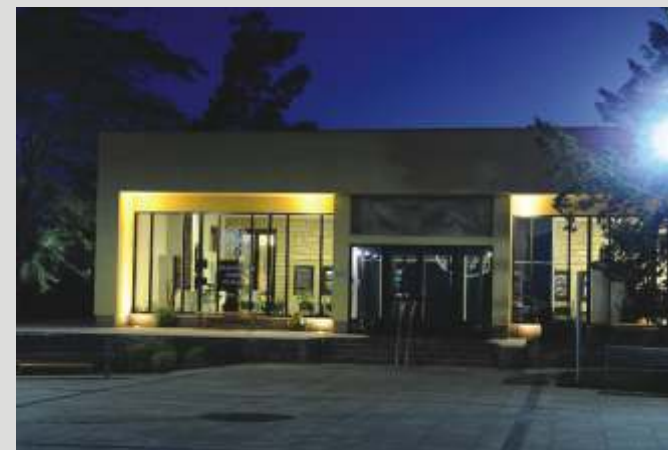
Památník Velké Moravy.