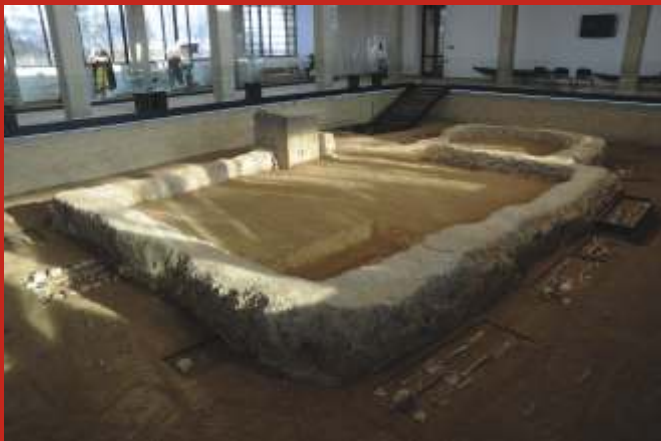
Pohled do expozice.