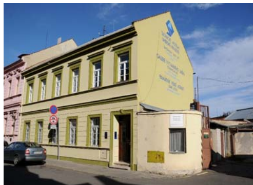
Konzervační oddělení Slovákckého muzea