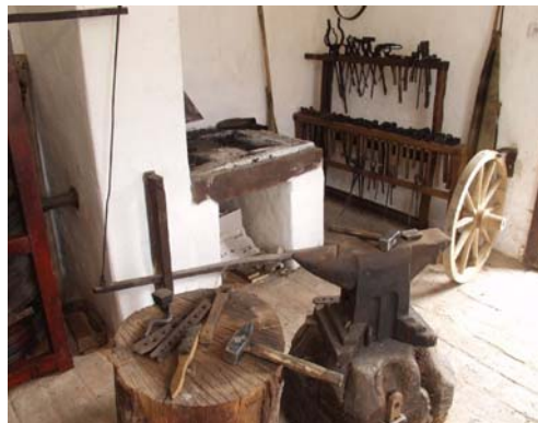
Expozice kovářství Topolná