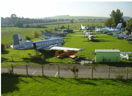
Letecké muzeum Kunovice