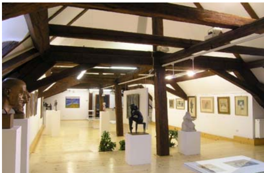
Expozice výtvarného umění jihovýchodní Moravy