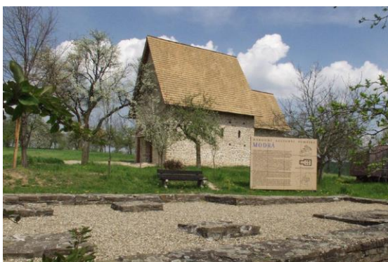
Národní kulturní památka – Modrá