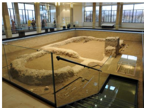
Památník Velké Moravy (stav po rekonstrukci)