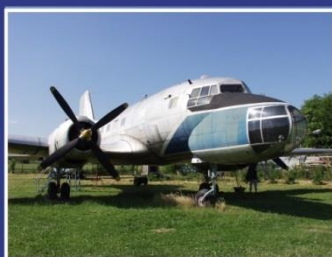
Letecké muzeum Kunovice