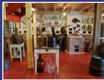
Muzeum lidových pálenic Vlčnov