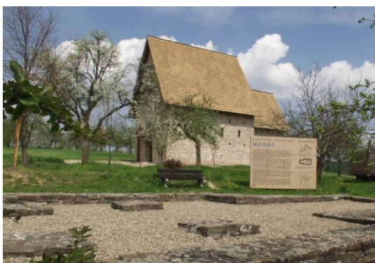
Národní kulturní památka – Modrá