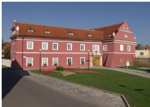
Galerie Slováckého muzea