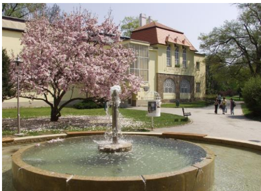
Slovácké muzeum – hlavní budova