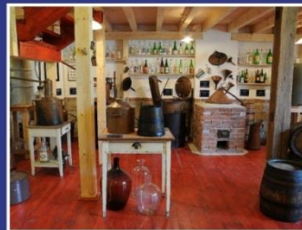
Muzeum lidových pálenic Vlčnov