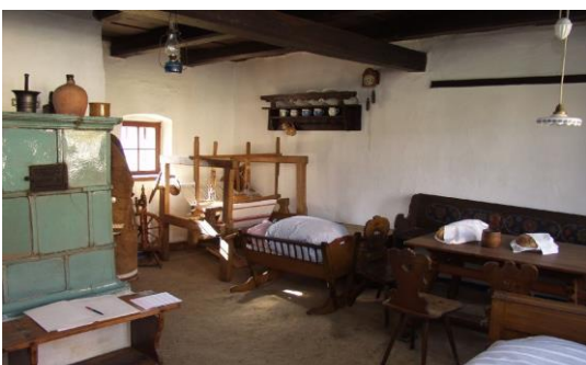
Expozice lidového bydlení Topolná