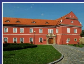
Galerie Slovákého muzea Uherské Hradiště