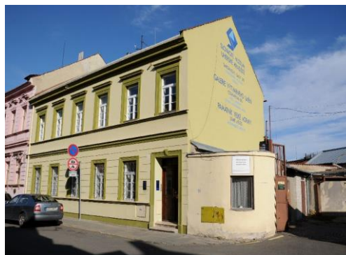
Konzervační oddělení Slovákého muzea