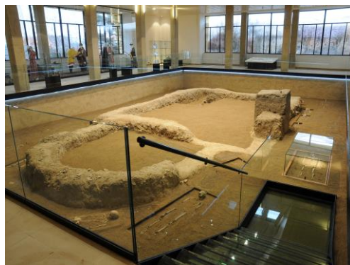
Památník Velké Moravy (stav po rekonstrukci)