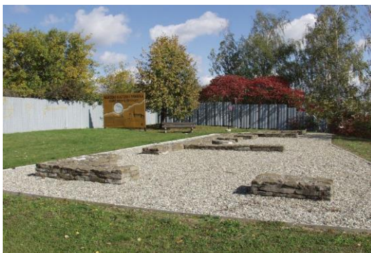
Národní kulturní památka – Staré Město – Špitálky