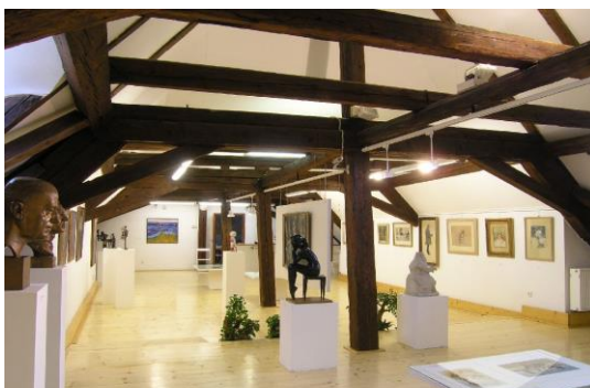
Expozice výtvarného umění jihovýchodní Moravy