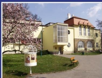
Slovácké muzeum Uherské Hradiště