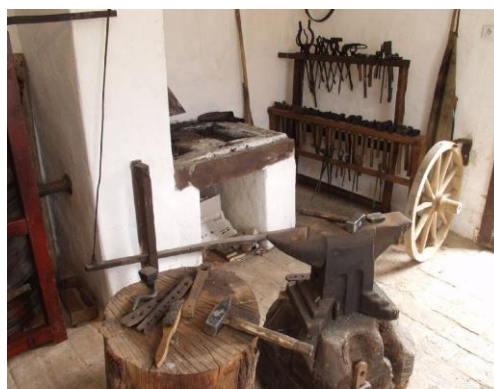
Expozice kovářství Topolná