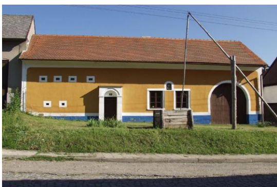
Soubor památek lidového stavitelství Topolná 90