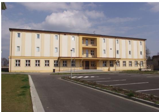
Přednáškové centrum s archeologickým oddělením