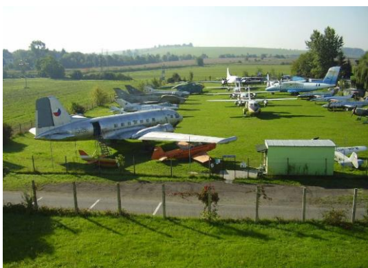
Letecké muzeum Kunovice