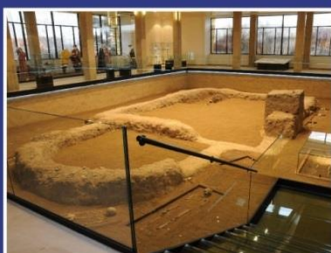
Památník Velké Moravy Staré Město