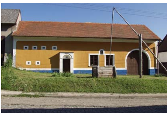
Soubor památek lidového stavitelství Topolná 90