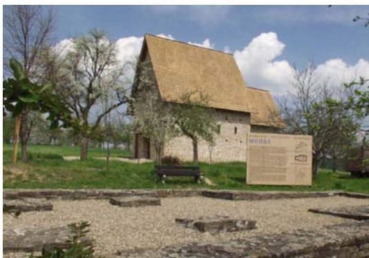
Národní kulturní památka – Modrá