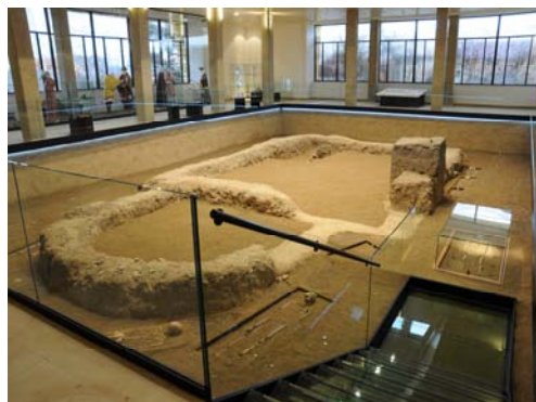
Památník Velké Moravy (stav po rekonstrukci)