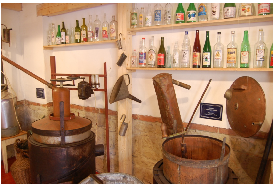
Expozice Muzea lidových pálenic Vlčnov