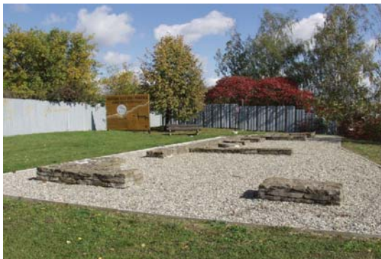
Národní kulturní památka – Staré Město – Špitálky