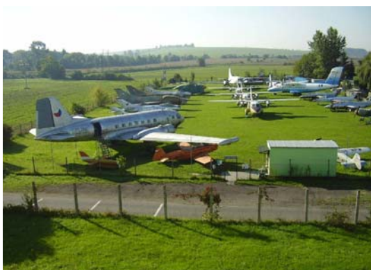
Letecké muzeum Kunovice