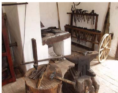
Expozice kovářství Topolná