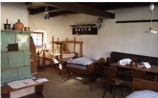
Expozice lidového bydlení Topolná