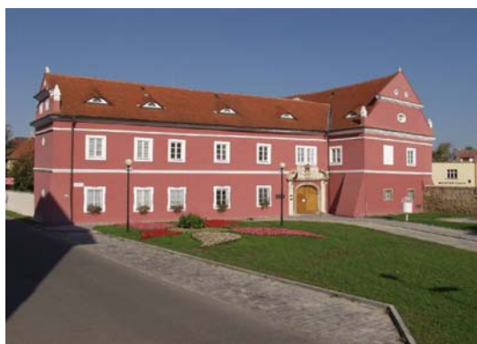
Galerie Slováckého muzea