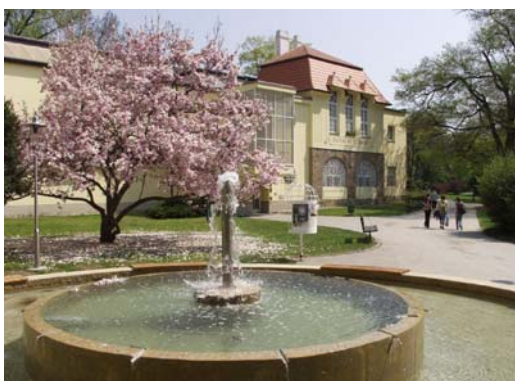
Slovácké muzeum – hlavní budova