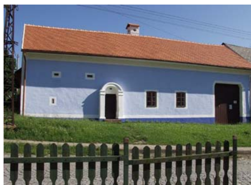
Soubor památek lidového stavitelství Topolná 93