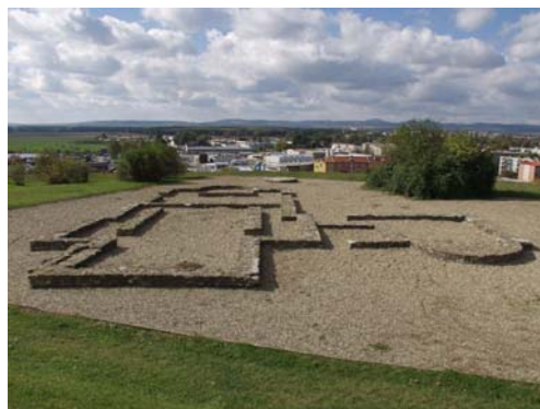
Národní kulturní památka – Uherské Hradiště - Sady