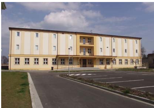
Přednáškové centrum s archeologickým oddělením