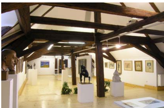
Expozice výtvarného umění jihovýchodní Moravy