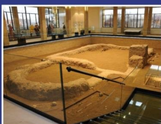
Památník Velké Moravy Staré Město