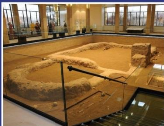
Památník Velké Moravy Staré Město