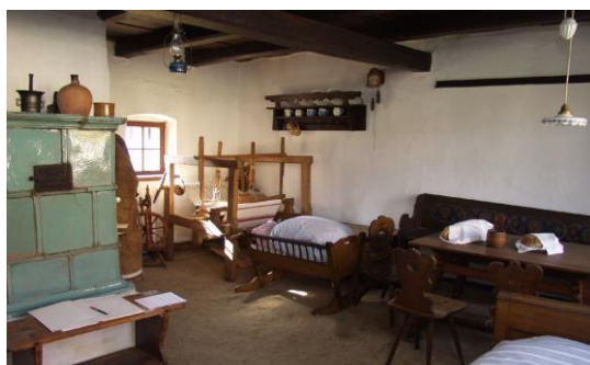
Expozice lidového bydlení Topolná